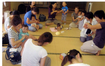
赤ちゃんおはなしの部屋 (親子で楽しむわらべ歌による手遊び)