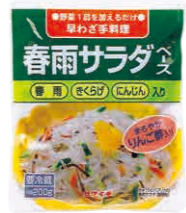
春雨サラダベース(2個組) 宅配予定 4月3回

妹からすすめられた「春雨サラダベース」にハマっています。きゅうり、ハム、卵を入れて食べています。酔が嫌いなわが家の男性軍もパクパク食べてくれます!