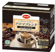
COOPコーヒーアロマブレンド

コーヒーアロマブレンドは夫がとっても美味しいと言います。福岡で単身赴任のため帰って来られないので、コープのノンとたまごスープ、コーヒーアロマブレンドを送ってほしいと言われて送りました。かなり気に入っているようです。早く帰って来られるよう、コロナが落ち着きますように。