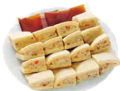
ひとくち鶏こつや豆腐(だしつゆ付)

私のお気に入りにはひとくち鶏こつや豆腐です。タレ付きで栄養価の高い高野豆腐に、わが家ではにんじんやきのこ、大根やキヌサヤを入れて煮込めば、仕事から帰ってあつという間に一品出来上がります。翌日に弁当のおかずとしてもOK!