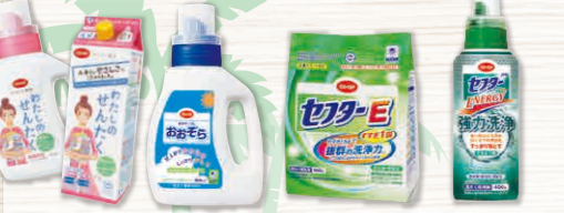
CO-OP わたしのせんたく CO-OP 液体せっけん おおぞら CO-OP セフターE CO-OP セフター ENERGY 強力洗浄