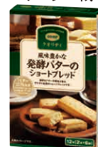
CO-OP風味豊かな発酵バターのショートブレッド 宅配予定 7月1回 店舗 取扱い

今、コープのショートブレッドを食べながらクイズに挑戦しております。ショートブレッドはバター風味とほど良く優しい甘さが本当に美味い!!これを超えるものがない!!次も絶対注文する!!