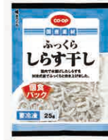
CO-OP ふっくらしらす干し 宅配予定 6月3回 店舗 取扱い ※店舗では包材が異なります。

ふっくらしらす干しがおすすめです。炊きたてご飯にかけて食べたり、わかめなどと混ぜて酢の物の一品にしたりと、メニューの幅が広がります。ほど良い潮の香りが食欲をそそります。