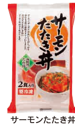
サーモンたたき丼 宅配予定 6月3回

注文書のおすめ「コメントを見て「美味しいのかな?」と思い注文(もともとサーモン大好き)。すぐ解凍できて、味も美味しいので、ピーターになっていきます。サーモンに付いているタレも美味しいから、さらに箸がすすみます。娘の桃の節句でちらし寿司を作ったとき、具として上にのせると味も彩りも良くなりました。常備しているのでも刺身を買いに行く手間もなく、良い桃の節句となりました。