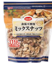
CO-OP食塩不使用 ミックスナッツ 宅配予定 6月2回 店舗 取扱い