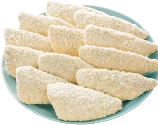
あじフライ ジャンポパック 宅配予定 8月1回