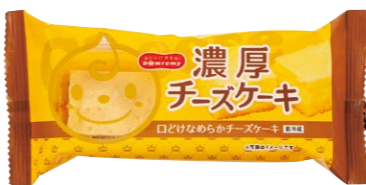
濃厚チーズケーキ 宅配予定 7月4回

フチ贅沢気分 濃厚チーズケーキがぶち美味 しい！小さいサイズなのでカロ リーを気にしすぎることなく食 べることができ、高級感が あって、フチ贅沢気分。ストレス のたまるこの頃に、もってこいの スイーツです。