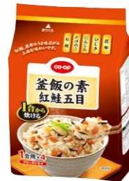
CO-OP釜飯の素 紅鮭五目(FD) 宅配予定 8月1回

魚が苦手でもこのあじフライは大好き！ 私のいちおしはシー サットのあじフライ ジャンポパック。魚が 苦手な子どもたちが、 お弁当に入れてほしい とリクエストしてくれ ます。夕食に困った時 にも大助かりです。