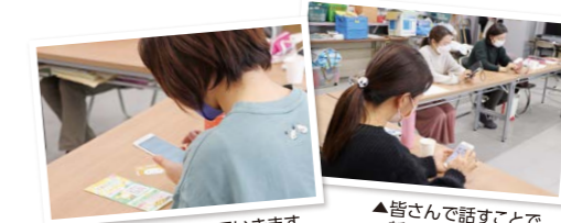
▲ここカードを連携していきます ▲皆さんで話すことで、新たに発見した機能も

お問い合わせはこちらから コープやまぐち 問合せセンター ☎0120-49-5657 月～金 8:30～21:00 土 8:30～18:00