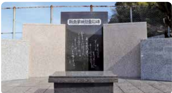
岩国高等学校「動員学徒慰霊の碑」