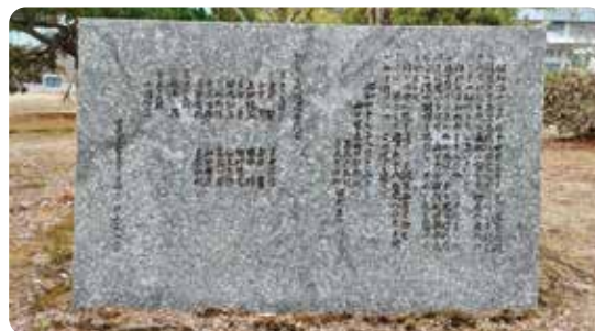
山口高等学校「動員学徒慰霊碑」