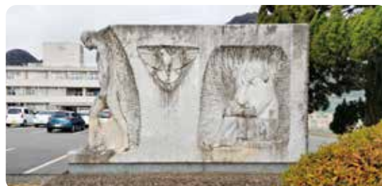
山口高等学校「平和の母子像」