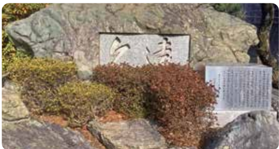
徳山高等学校「久遠の碑」