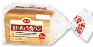
せいぎょう食パン 毎週 取扱い