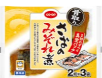
骨取りさばのみぞれ煮 宅配予定 6月2回 店舗 取扱い