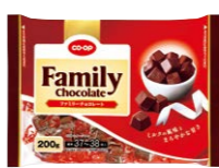
ファミリーチョコレート 宅配予定 6月4回 店舗 取扱い