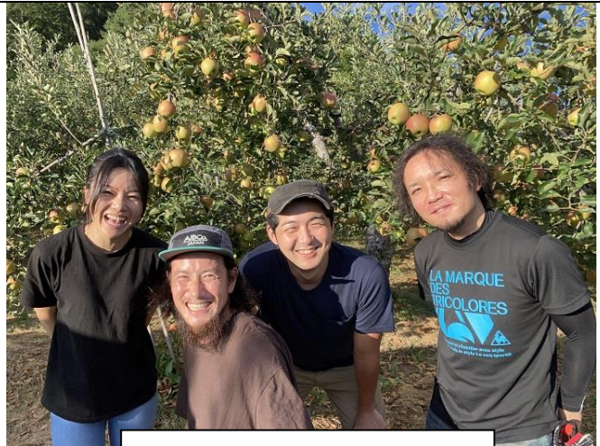
次世代を担う生産者の皆さん