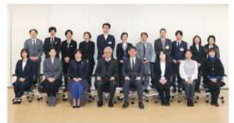
伊藤和貴 山口市長(前列左から5人目)と。(1/29)▲

湯田こんこんパークに、防災にも考慮された設備が多く設置されていることや、河川の氾濫に対する防災・減災の取り組みについてお聞きしました。コープからは、防災ポーチやアレルギー対応ぶた井調味料キットを展示し、ポリ袋調理の活用についてや、職員1,000人×3日分の備蓄品の準備をしていることなど、具体的な取り組みを紹介しました。展示等を通じて交流することができ、今後連携強化につながる懇談となりました。