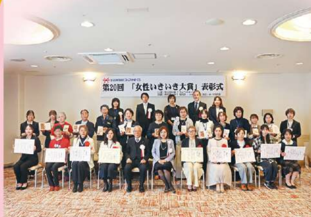
▲3月4日の表彰式の様子