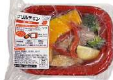
▲グリルチキン 照り焼き