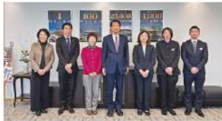
池田豊 防府市長(中央)と。(1/21)▲

災害時における避難と防府市の防災対策についてお聞きしました。具体的な取り組みとして、高齢者世帯へ防災ラジオを配布したり、有事に備え、全市役所職員で防災訓練を行ったりしているそうです。子ども・市民が防災に親しむ場としてメバル公園を整備。また防災広場や道路整備が進められています。協定の確認だけでなく、有事の連絡体制やホットラインの明確化など、日頃からの連携の必要性を感じました。