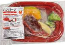
▲ハンバーグ 煮込みソース