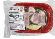
▲厚切りベーコン&ポテトとほうれん草