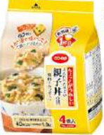
CO-OP ちよつとが うれしい ふんわり たまごの 親子丼の具