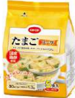
CO-OP たまごスープ 5食入

お湯を注ぐだけでできる、優し い味わいのふわふわたまごスー プでホットする食卓に♪