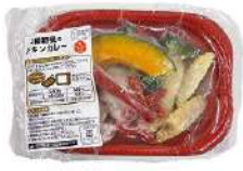
▲4種野菜のチキンカレー