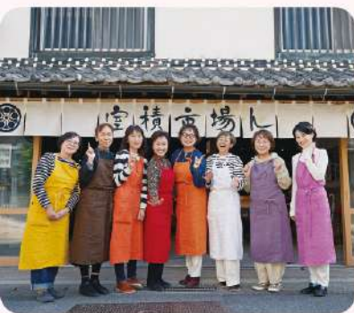
▲室積市場ん合同会社の皆さん