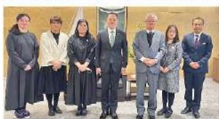
篠崎圭二 宇部市長(中央)と。(1/13)▲

安心して暮らせる居場所づくりの推進について意見交換しました。コープも「ときわ湖畔ウォーク」や「エコクッキング」「離乳食試食会と子ども服リユース」など、継続した健康と交流の場づくりに協働していることを報告しました。防災については、公助と共助がうまく機能する体制づくりが求められており、これまで以上に協働できることを見つけていけるよう、多くの施策を紹介していただきました。