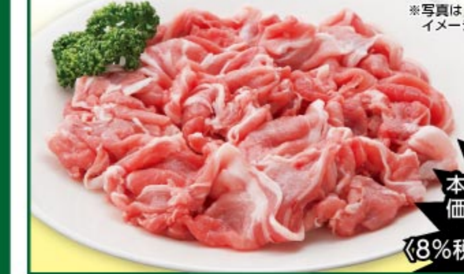
国産豚こまぎれ 100gあたり 本体価格 108 円 (8%税込参考価格) 116 円