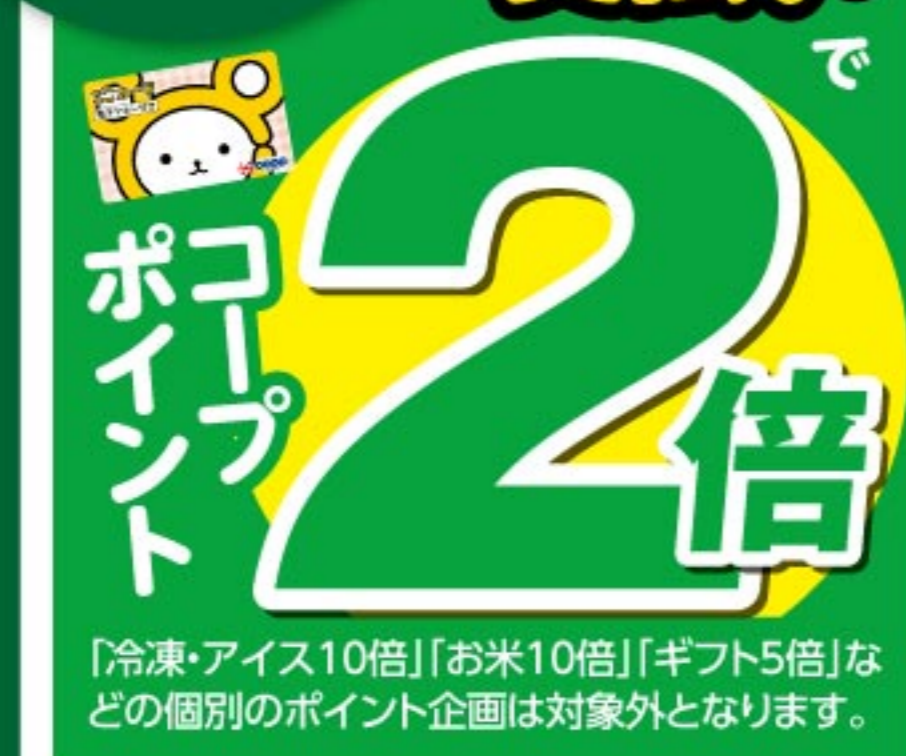
「冷凍・アイス10倍」「お米10倍」「ギフト5倍」などの個別のポイント企画は対象外となります。

6/24 水 限り ココカ(電子マネー)支払い コープポイント 2 倍 ※写真はイメージです。