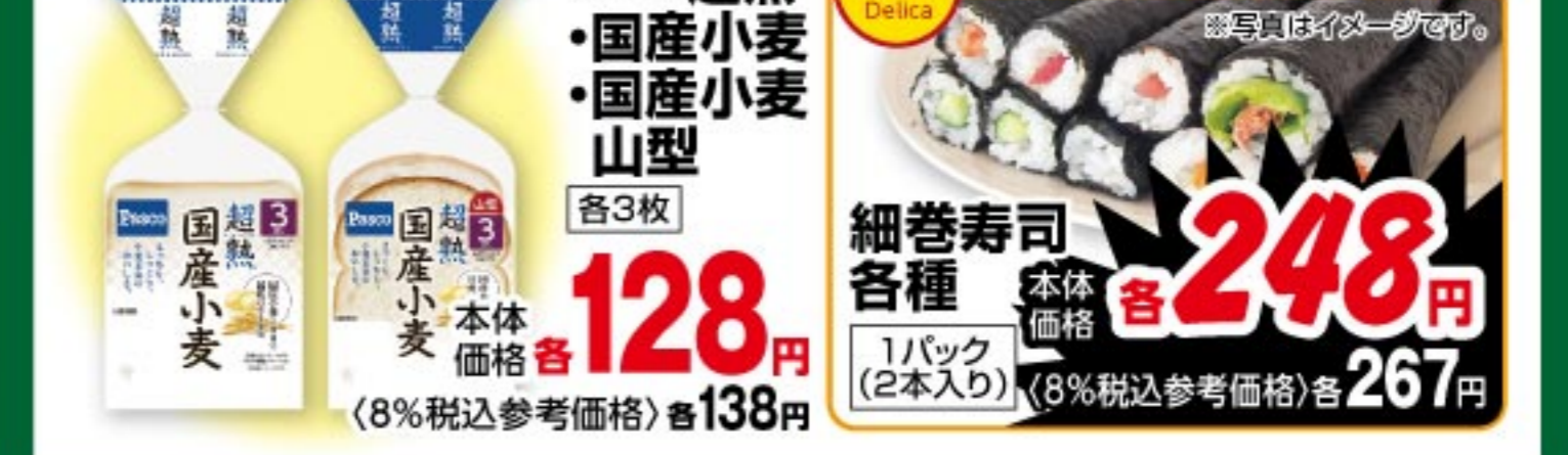
パスコ 超熟・国産小麦・国産小麦山型 各3枚 本体価格 128 円 (8%税込参考価格) 138 円 細巻寿司 各種 1パック(2本入り) 本体価格 248 円 (8%税込参考価格) 267 円