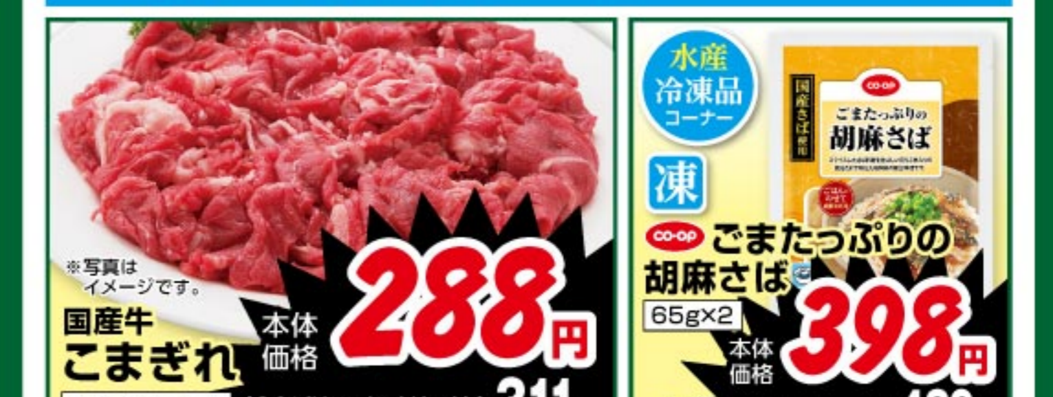
国産牛こまぎれ 100gあたり 本体価格 288 円 (8%税込参考価格) 311 円 水産冷凍品コーナー 凍ごまたっぷり胡麻さば 65g×2 本体価格 398 円 (8%税込参考価格) 429 円