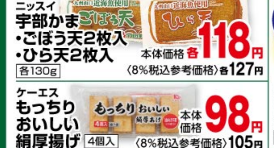
ニッスイ 宇部かまごぼろ天2枚入・ひら天2枚入 各130g 本体価格 118 円 (8%税込参考価格) 127 円 ケースもっちりおいしい絹厚揚げ 4個入 本体価格 98 円 (8%税込参考価格) 105 円