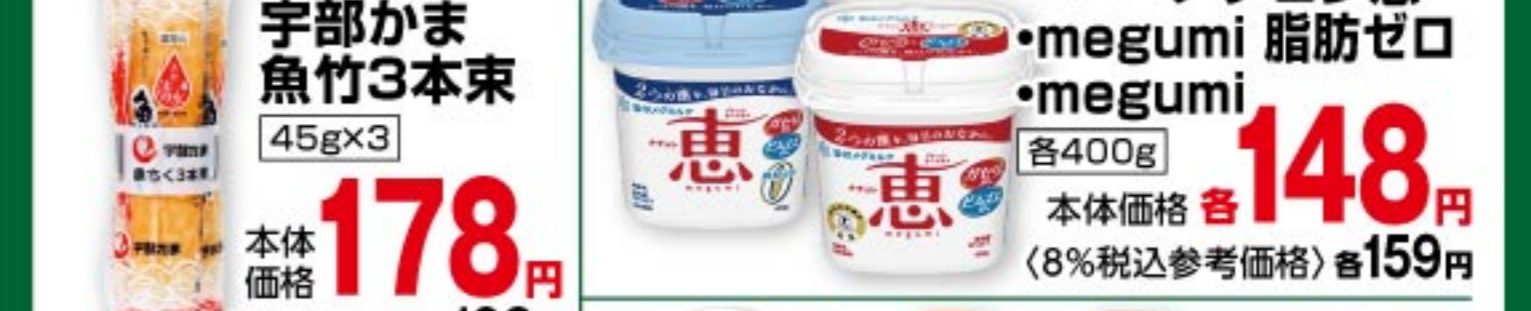
ニッスイ 宇部かま魚竹3本束 45g×3 本体価格 178 円 (8%税込参考価格) 192 円 雪印メグ ナチュレ恵・megumi 脂肪ゼロ・megumi 各400g 本体価格 148 円 (8%税込参考価格) 159 円