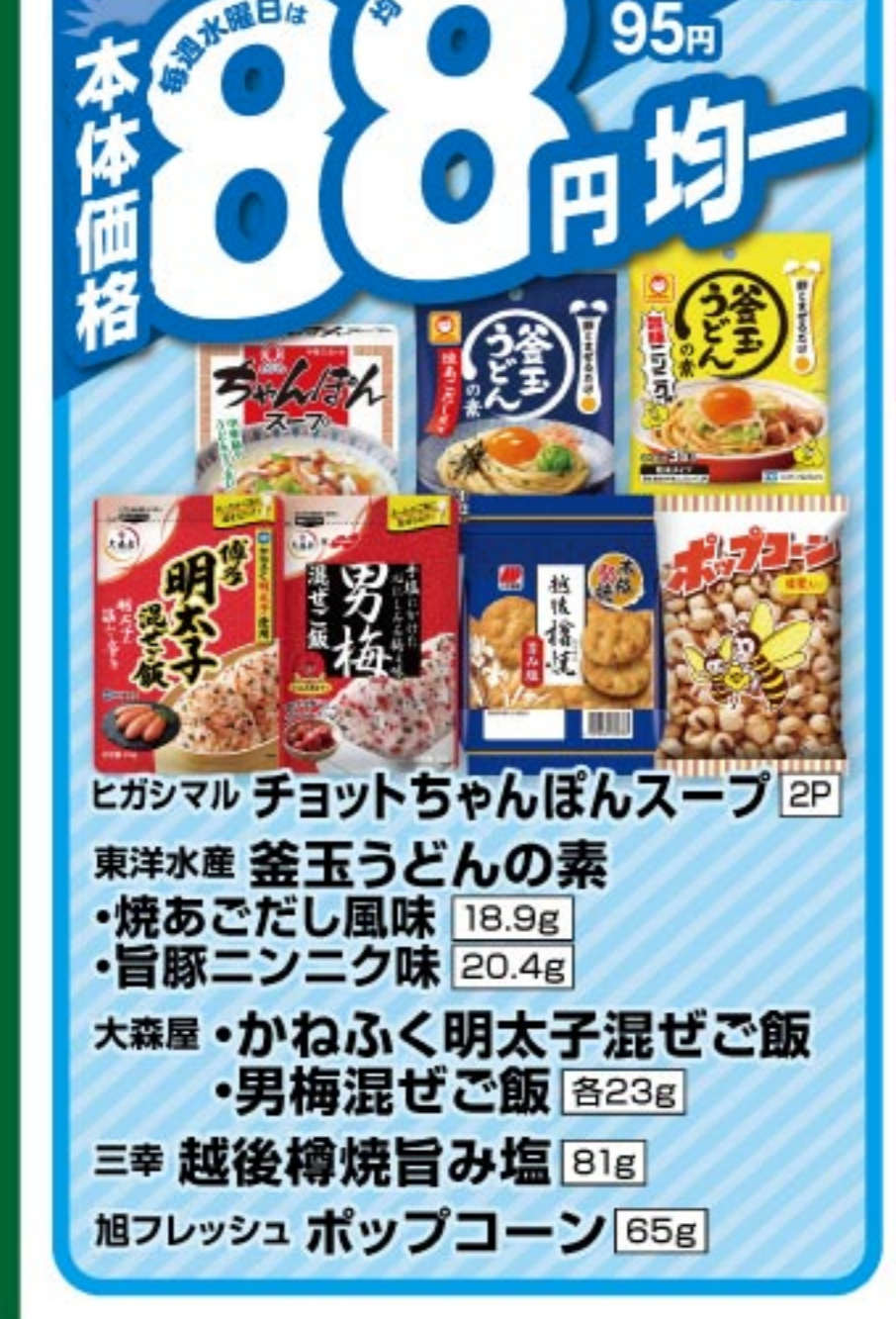
ヒガシマル チョットちゃんぽんスープ 2P 8%税込参考価格 95 円 本体価格 88 円均一