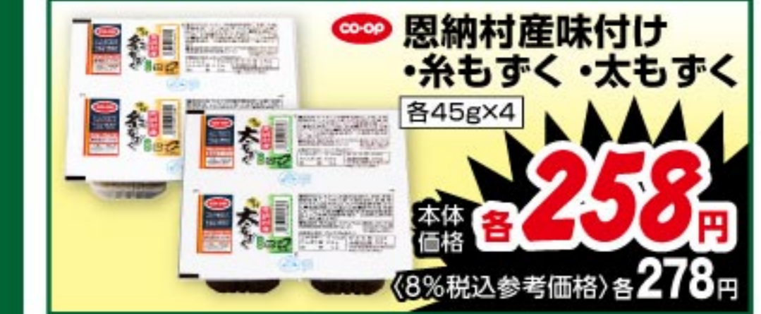
恩納村産味付け糸もずく・太もずく 各45g×4 本体価格 258 円 (8%税込参考価格) 278 円