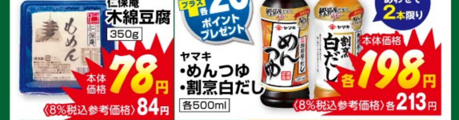
仁保庵 木綿豆腐 350g 本体価格 78 円 (8%税込参考価格) 84 円 ヤマキ めんつゆ・割烹白だし 各500ml 本体価格 198 円 (8%税込参考価格) 213 円