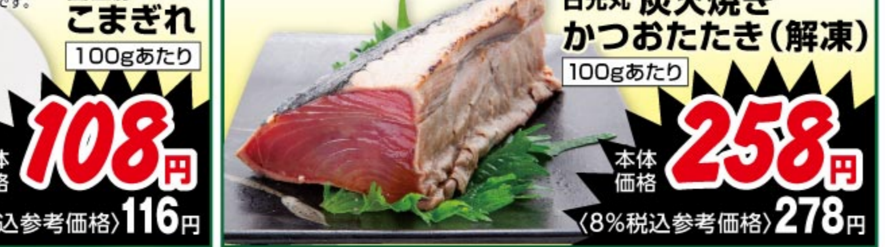
日光丸 炭火焼きかつおたたき(解凍) 100gあたり 本体価格 258 円 (8%税込参考価格) 278 円