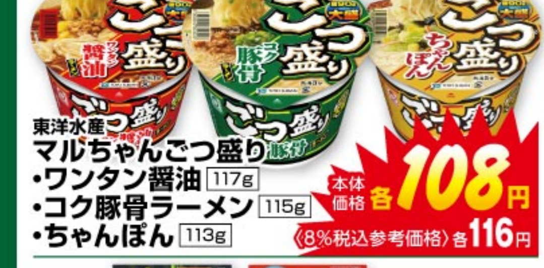
東洋水産 マルちゃんごつ盛り 117g 本体価格 108 円 (8%税込参考価格) 116 円 ・ワンタン醤油 115g ・コク豚骨ラーメン 113g ・ちゃんぽん