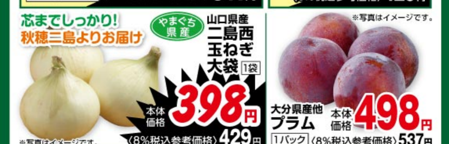
山口県産二島西玉ねぎ大袋 1袋 本体価格 398 円 (8%税込参考価格) 429 円 大分県産他大分産プラム 1パック 本体価格 498 円 (8%税込参考価格) 537 円