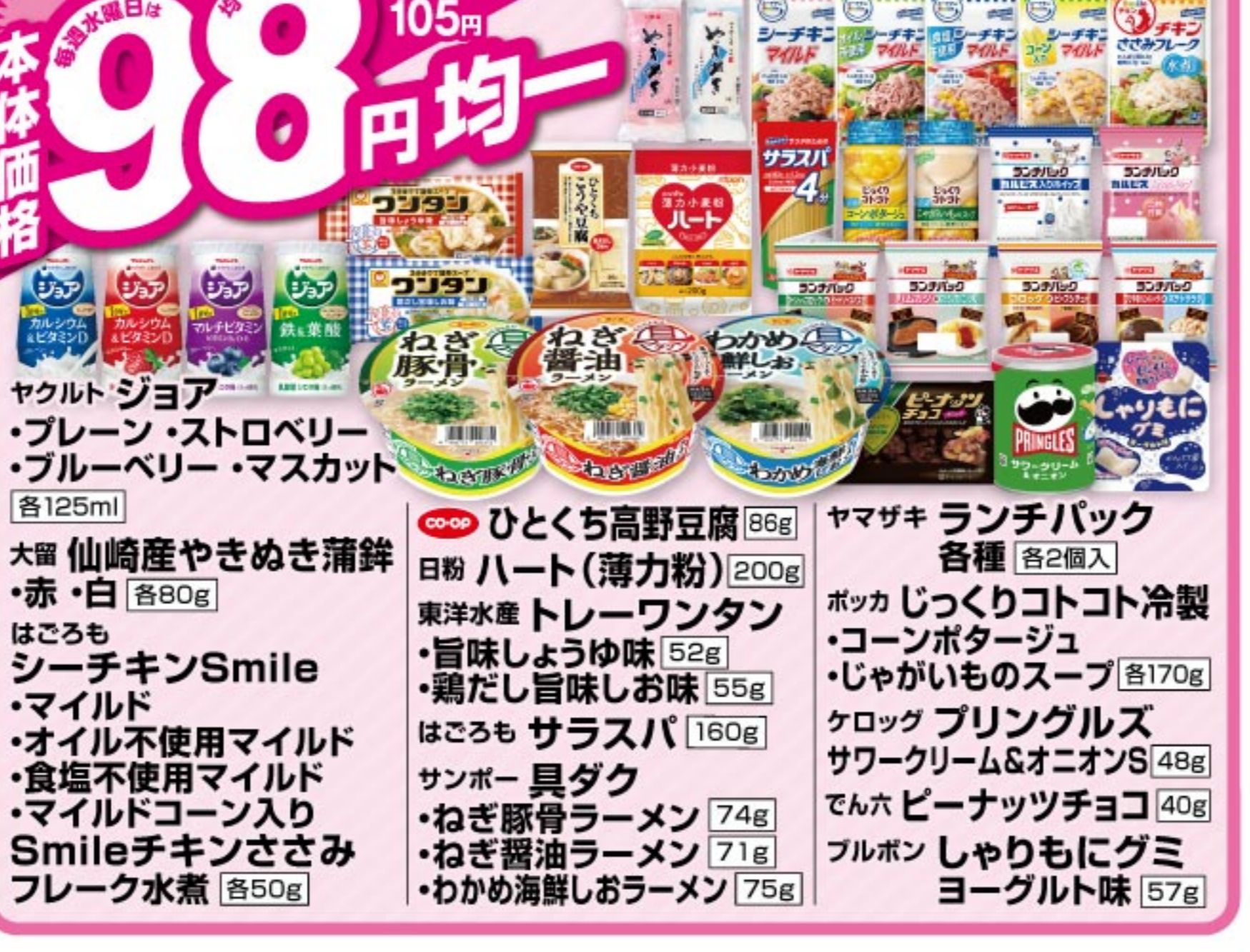
ヤマザキ ランチパック 各種 各2個入 本体価格 98 円均一 (8%税込参考価格) 105 円

6/25 木 限り チャージDAY ここカードにチャージするとチャージ金額に対し 2% プレゼント! 5のつく日は 電子マネー 例 10,000円チャージで 200円の電子マネープレゼント ※一部対象外商品があります。 ※対象の冷凍食品・アイスは買い上げ合計200円(税抜)以上がポイント10倍の対象となります。