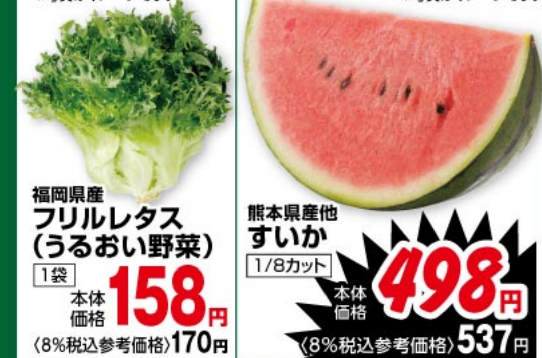
福岡県産フリルレタス(うるおい野菜) 1袋 本体価格 158 円 (8%税込参考価格) 170 円 熊本県産他すいか 1/8カット 本体価格 498 円 (8%税込参考価格) 537 円