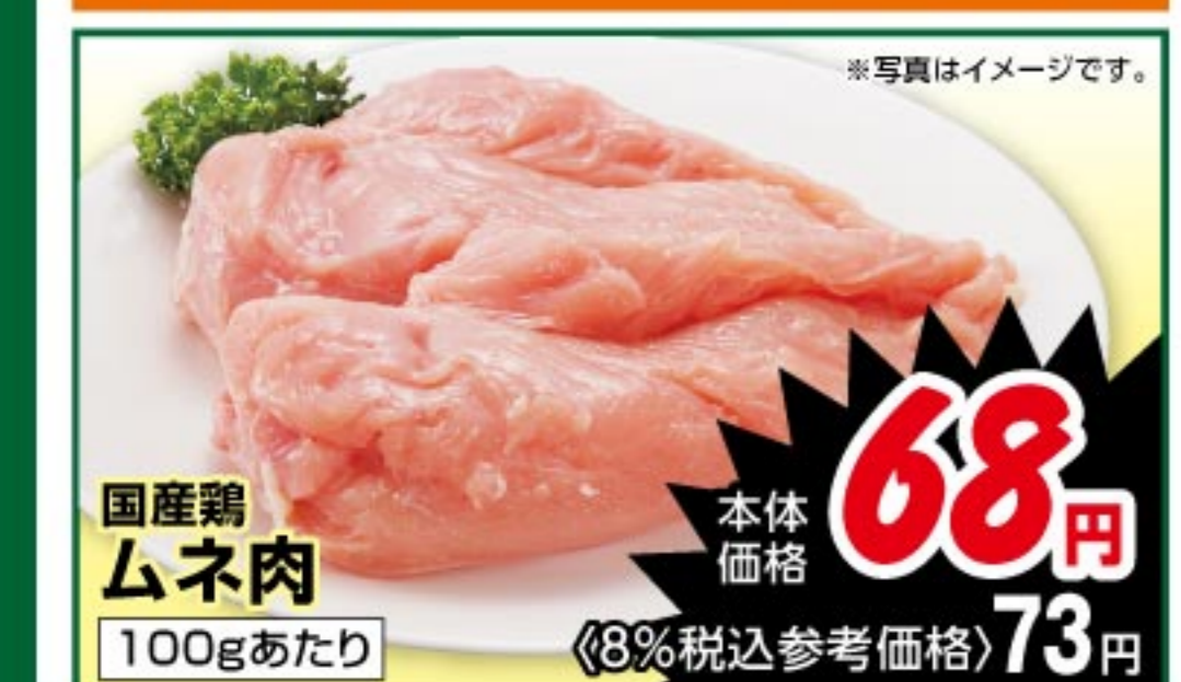
国産鶏ムネ肉 100gあたり 本体価格 68 円 (8%税込参考価格) 73 円

6/23 火 限り ハム・ソーセージ コープポイント 10 倍 ※一部対象外商品があります。 ※対象のハム・ソーセージは買い上げ合計200円(税抜)以上がポイント10倍の対象となります。