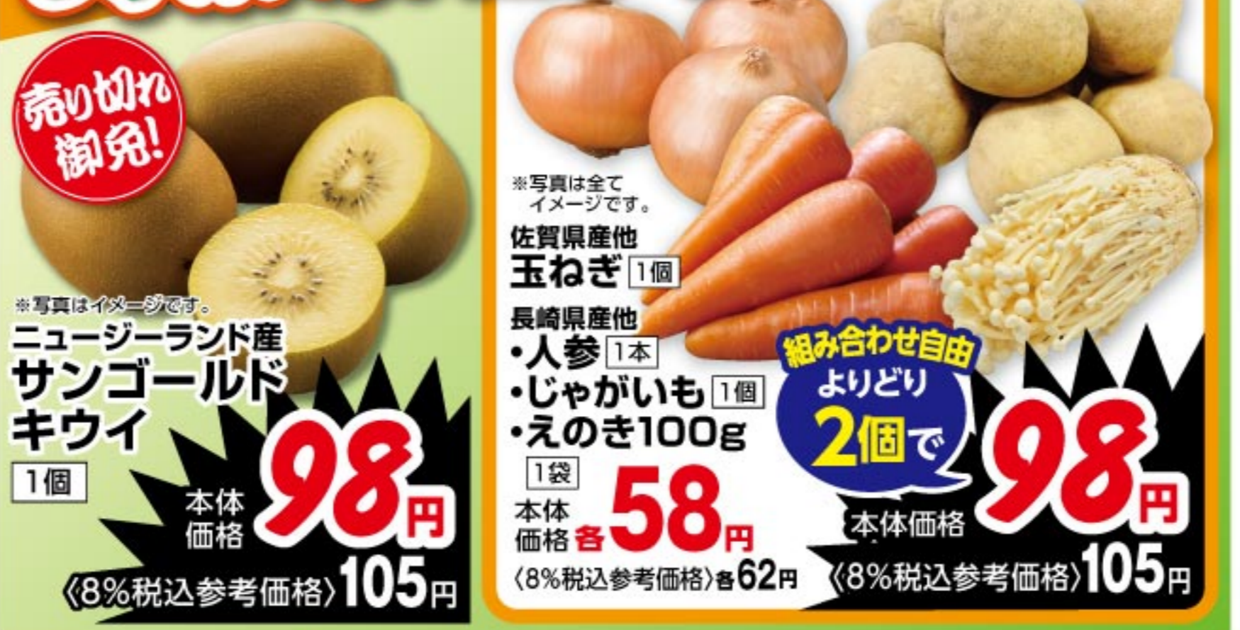
佐賀県産他玉ねぎ 1個 本体価格 58 円 (8%税込参考価格) 62 円 長崎県産他人参 1本 本体価格 98 円 (8%税込参考価格) 105 円 ・じゃがいも 1個 ・えのき100g 1袋