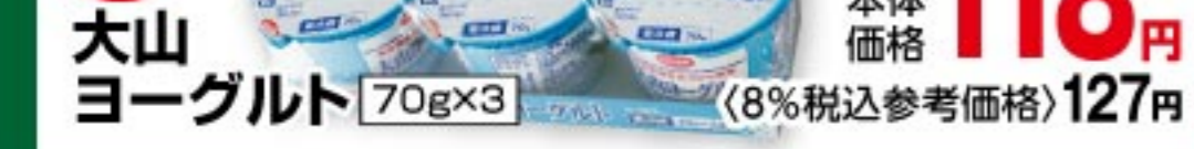
大山 ヨーグルト 70g×3 本体価格 118 円 (8%税込参考価格) 127 円

6/24 水 限り ココカ(電子マネー)支払い コープポイント 2 倍 ※写真はイメージです。